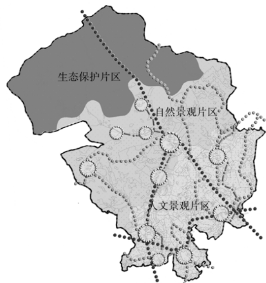
图 2 绿地景观规划结构:“三片、三带、多区” Fig. 2 Green landscape planning structures: three areas, three belts, multi zones

构成“一心、三带、三片、五点”的乡村产业结构(图 3):其中“一心”指旅游产业服务中心,有葛仙观、摩崖石刻等特色旅游点;“三带”指一条主要旅游产业分布带,两条特色产业分布带;“三片”指