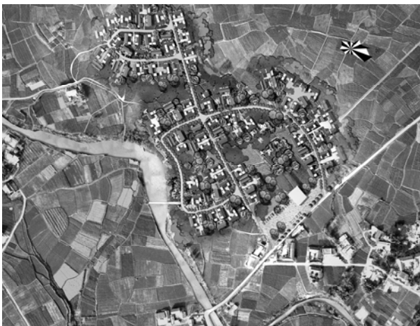
图 4 熙玉村 19 社灾后重建定居点规划总平面图 Fig. 4 General plane-graph of settlement planning of post-disaster reconstruction of Xiyu Village

秉承因地制宜、顺应自然的传统川西村落布局与建设的主导思想，突出民居建筑特色(图 4)。平行水岸的街道成为林盘中的主要骨架，与纵横阡陌的小巷交织在一起，林盘整体街道便呈鱼骨状。主要街道也是划分居民点分布的主要依托，以此形成了一个以多家农舍形成的点状居住单元，居住单元以“社”为单位。没有大广场式的公共空间，街道成为许多居民进行社交的主要场所媒介。与传统林盘不同，新居不